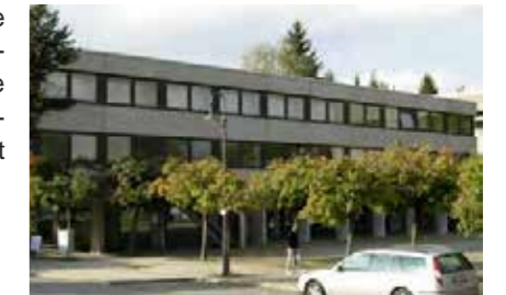
Zustand vor der Sanierung

von Vakuumdämmung. Eine moderne Lüftungstechnik mit Wärmerückgewinnung in beiden Pfarrsälen sowie Chorprobenraum reduziert die Lüftungswärmeverluste und erhöht den Komfort in den Räumen.