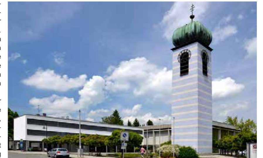
Das Pfarrzentrum bildet zusammen mit Kirche und Turm ein prägnantes städtebauliches Element.

Bei der gesamten Gebäudehülle war der Wärmeschutz sehr mangelhaft. Sie erhielt eine hochwertige Dämmung, sowie neue Fensterelemente mit Dreifachverglasung. Bisherige Wärmebrücken wurden mit besonderer Sorgfalt behandelt, teilweise unter Anwendung