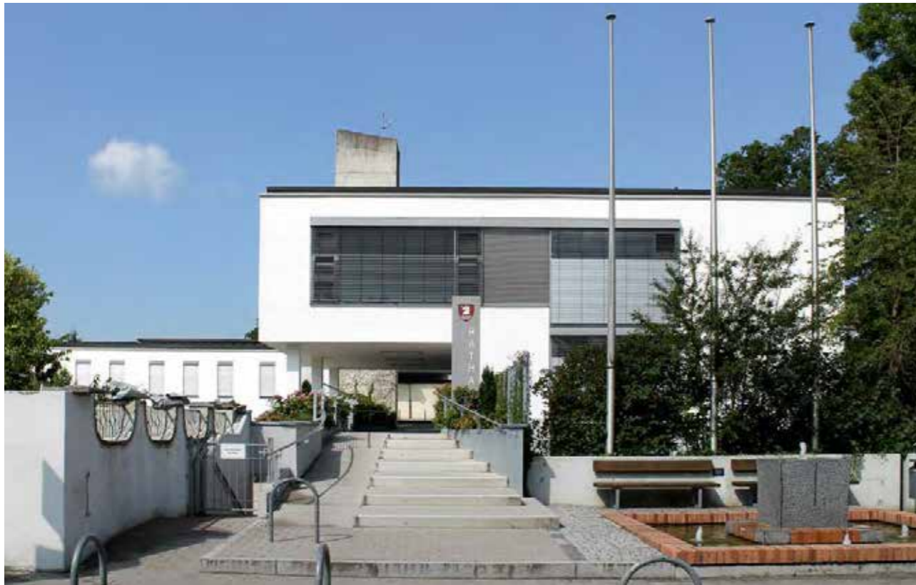
Das Rathaus ist jetzt barrierefrei zu erreichen