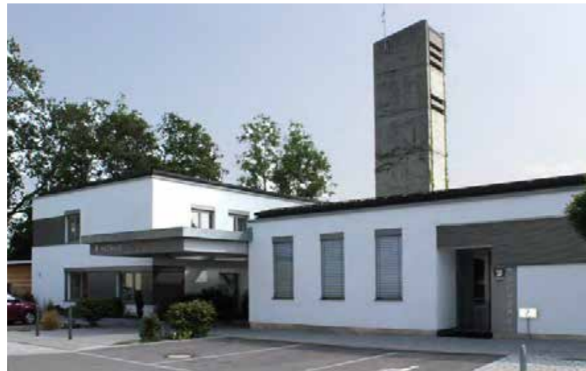
Ansicht vom Bahnhof

Bei dem Rathaus mit Bücherei und Feuerwehr in Schondorf am Ammersee handelt es sich um ein Gebäude aus dem Jahr 1972. Nach knapp 40 Jahren Nutzung haben sich die Bedürfnisse und Anforderungen geändert und das Rathaus wies nicht nur energetische Mängel auf. Auch die Zuschnitte der Büros und die Arbeitsplätze entsprachen nicht mehr den aktuellen Anforderungen. Im Bürgerbüro werden heute keine Schalter, sondern Tische benötigt, das Gebäude soll barrierefrei erreichbar sein und eine Durchlässigkeit vom Bahnhof zur Hauptstraße war auch erwünscht. So wurde im Jahr 2009 mit Hilfe der Finanzierung aus dem Konjunkturpaket II das Rathaus energetisch saniert, die Außenfassaden und das Dach gedämmt und die Fenster erneuert. Im Zuge der Sanierung wurde ein barriere-