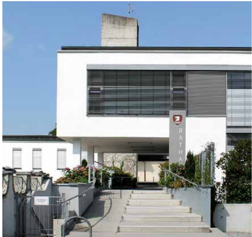
Rathaus in Schondorf