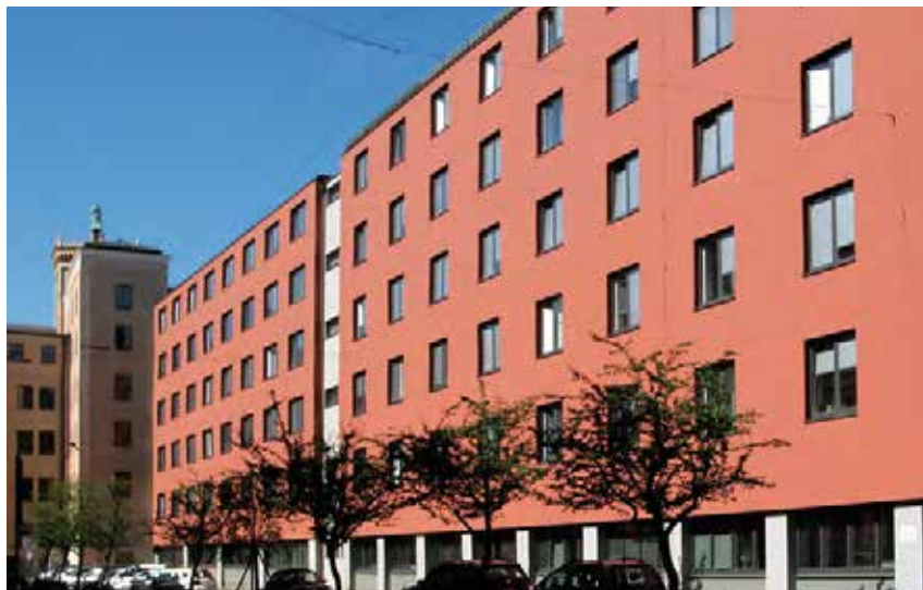
unten: vor der Sanierung ganz unten: nach der Sanierung

Der Rotton der neuen Fassade ist den Arkaden entlehnt und fügt den Bau har-