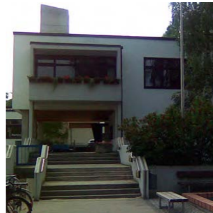
vorher: kein barrierefreier Zugang zum Rathaus

Bei dem Rathaus mit Bücherei und Feuerwehr in Schondorf am Ammersee handelt es sich um ein Gebäude aus dem Jahr 1972. Nach knapp 40 Jahren Nutzung haben sich die Bedürfnisse und Anforderungen geändert und das Rathaus wies nicht nur energetische Mängel auf. Auch die Zuschnitte der Büros und die Arbeitsplätze entsprachen nicht mehr den aktuellen Anforderungen. Im Bürgerbüro werden heute keine Schalter, sondern Tische benötigt, das Gebäude soll barrierefrei erreichbar sein und eine Durchlässigkeit vom Bahnhof zur Hauptstraße war auch erwünscht. So wurde im Jahr 2009 mit Hilfe der Finanzierung aus dem Konjunkturpaket II das Rathaus energetisch saniert, die Außenfassaden und das Dach gedämmt und die Fenster erneuert. Im Zuge der Sanierung wurde ein barriere-