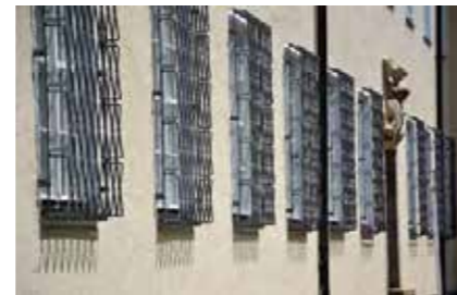
Insgesamt wurden von den 204 Fenstern des Rathauses 172 saniert

2. Erhalt des historischen Fensters, Verglasung des Innenflügels mit dünnem Spezialisoliertglas, Verbesserung der Dichtigkeit und Bedienbarkeit, Erhalt der historischen Scharniere und Griffe. Die Fensterbänke aus schwarzem Kunststein wurden ebenfalls überarbeitet und blieben erhalten. Neben der Energieeinsparung konnte der Komfort in den Räumen erheblich gesteigert werden.